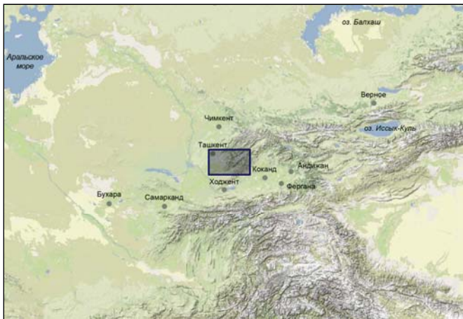
Вид и карта Ахангаранской долины